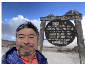
キリマンジャロ登頂成功

あらゆる年代の方にお楽しみいただける興味深い内容です。多くの方のご参加をお待ちしております。