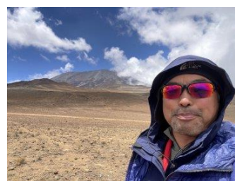
キリマンジャロを背景に